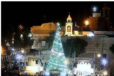
Bethlehem Manger Square - Krippenplatz

Wir wünschen Ihnen ein gesegnetes Weihnachtsfest und einen guten Start in das Jahr 2018.